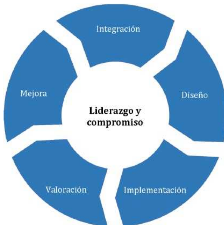
Figura 3 — Marco de referencia

La organización debería valorar sus prácticas y procesos existentes de la gestión del riesgo, valorar cualquier brecha y abordar estas brechas en el marco de referencia.