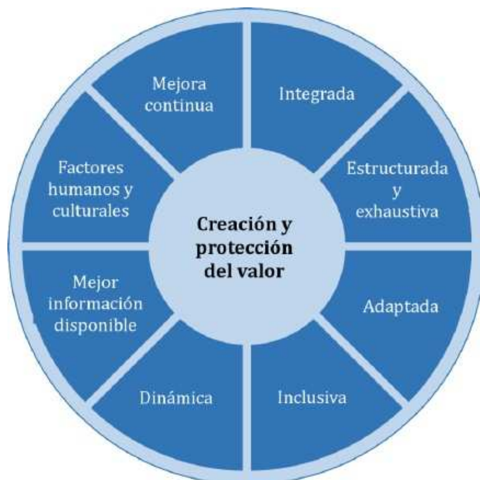
Figura 2 — Principios

Los principios descritos en la Figura 2 proporcionan orientación sobre las características de una gestión del riesgo eficaz y eficiente, comunicando su valor y explicando su intención y propósito. Los principios son el fundamento de la gestión del riesgo y se deberían considerar cuando se establece el marco de referencia y los procesos de la gestión del riesgo de la organización. Estos principios deberían habilitar a la organización para gestionar los efectos de la incertidumbre sobre sus objetivos.